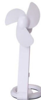
Ventilación da sala

FEDERACIÓN GALEGA DE JUDO E D.A. – www.fgjudo.com datos@fgjudo.com Entidade de utilidade pública conforme a lei 3/2012, do 2 de abril e inscrita no Rexistro de Clubs e Federacións da Xunta de Galicia nº 331 Praza Agustín Díaz nº 3 (Polideportivo Elviña)– 15008 A CORUÑA – TLF. 981.133758