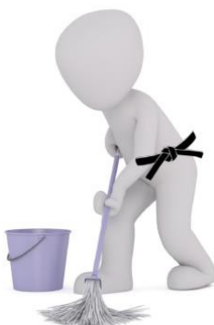
Limpeza do tatami e material didáctico